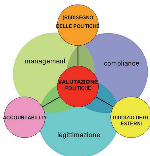
Figura 1.1 - Le principali funzioni delle assemblee legislative